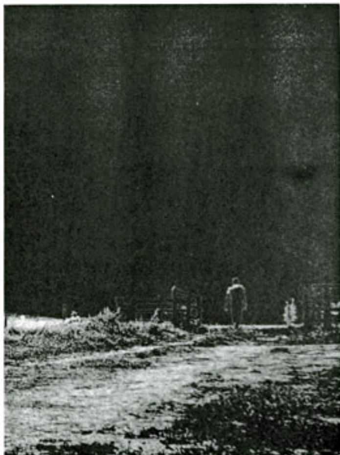
1º PRÊMIO: Composição com Figura Carlos Zanin I.F.G.